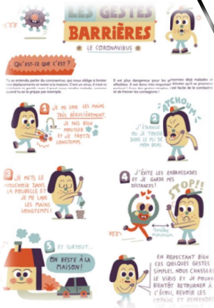
l'affiche des gestes barrières