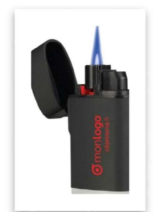
un briquet pour brûler les papiers usagés