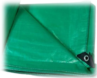
mon carré de bâche en cas de pluie