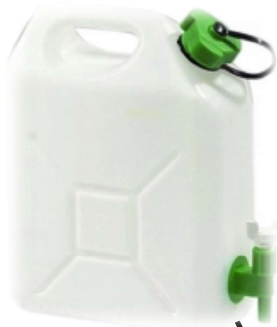
une réserve d'eau