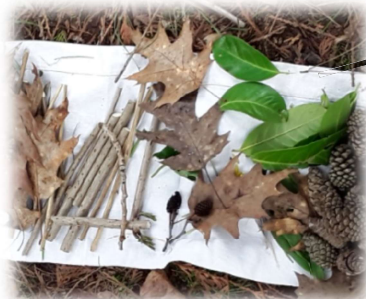
un drap blanc pour déposer des éléments naturels et inventer une histoire