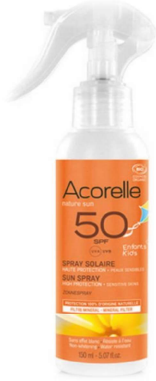
un spray solaire