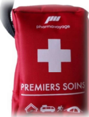
la trousse de secours