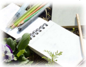
mon carnet d'observations des actions des élèves